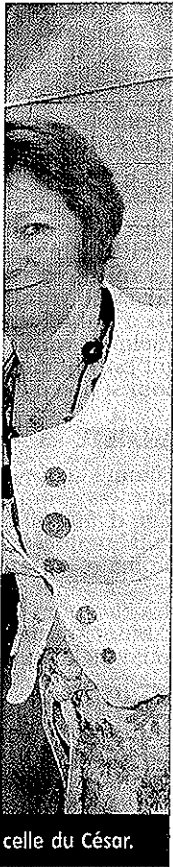
celle du César.