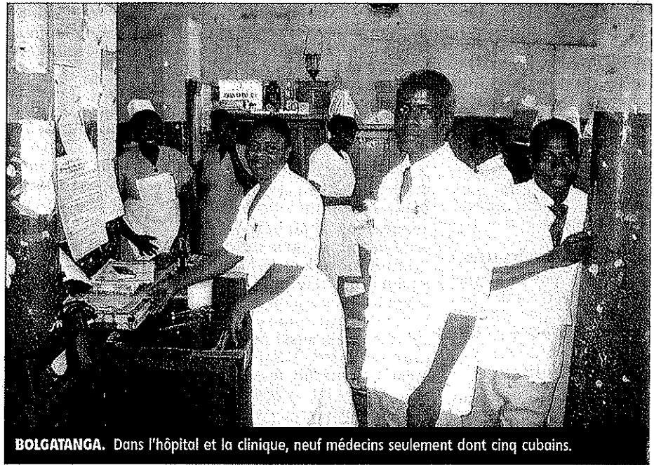
BOLGATANGA. Dans l'hôpital et la clinique, neuf médecins seulement dont cinq cubains.